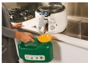
Filtra tu aceite usado con los accesorios suministrados

Su línea y sus dimensiones se adaptan a cualquier tipo de cocina o ambiente.