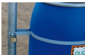
Anillo del anclaje del marco

Panel posterior de identificación de la estación de recogida ACEITE VEGETAL dim. 18x50cm; placa para fijación a pared (tacos excluidos)