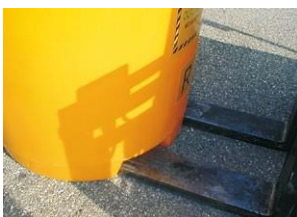
Base de forma práctica para el transporte

OLIVIA 500 OLIVIA 500 free consta de dos contenedores insertados uno dentro del otro. El contenedor externo actúa como un tanque de retención y tiene una forma que permite desengancharlo fácilmente y transportarlo con una carretilla elevadora una vez lleno. Fabricado en PEHD apto y resistente a las agresiones de los agentes atmosféricos y aceites, es fácilmente posicionable y transportable, ya que ha sido diseñado y construido para facilitar su recuperación incluso lleno en caso de necesidad (congelación de aceite, mantenimiento extraordinario y/o rutinario). De hecho, tiene tomas especiales que permiten moverlo fácilmente utilizando una transpaleta común con un contenedor vacío, o una carretilla elevadora con un contenedor lleno, que se puede inspeccionar y limpiar porque tiene una tapa superior equipada con una palanca de resorte, cierre y cerradura con llave codificada. El contenedor interno, también de HDPE, tiene una capacidad de contención de 495 litros. y está dotado de una gran boca para la recuperación del aceite gastado que se cierra herméticamente mediante un tapón de rosca con una junta especial.