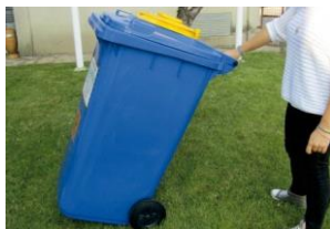
Simplifica la operación