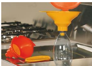
Entrada para adaptarse a varios modelos de botellas