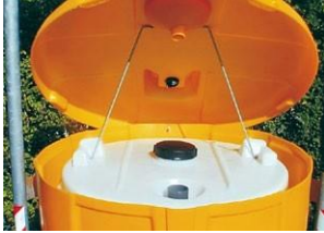
Fácilmente inspeccionable gracias a la barra de sujeción de la tapa