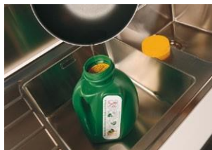
Filtrar y recuperar con la parrilla suministrada

OLI está disponible bajo pedido en la versión 3L Código 03000 equipada con un adecuado margen de seguridad para el llenado.