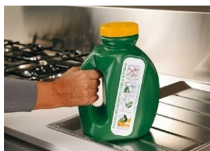
Es fácilmente transportable