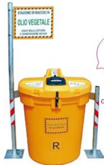
Olivia 200 New