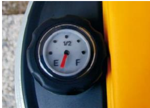
Indicador de nivel

Las tapas NCP y H-OLI son aptas para soportar los agentes atmosféricos y han sido fabricadas para facilitar la entrega de aceite a granel y aumentar la seguridad del usuario que lo utiliza.