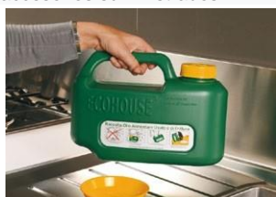
Es fácilmente transportable