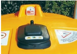
Equipado con tapa NCP e indicador de nivel