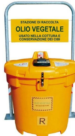
Olivia 500 Free roll-bar

OLIVIA NEW cod. OV-60.100D – Idóneo para su colocación en jardines públicos y otros espacios, está dotado de postes de protección lateral y de anclaje al suelo con anclajes adecuados (anclajes no incluidos), resistiendo así a los agentes atmosféricos muy intensos que pudieran volcar el propio contenedor, y la Panel de identificación tipo bandera con adhesivo específico.