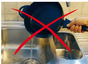
Tirar el aceite usado por el desagüe es altamente contaminante