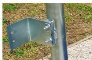
Placa opcional para montaje pared

Más seguro por la presencia de adhesivos antideslizantes en las rampas