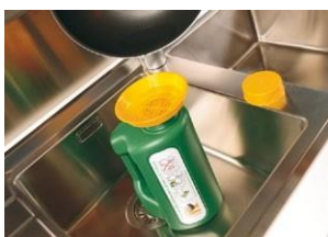
Filtra con embudo