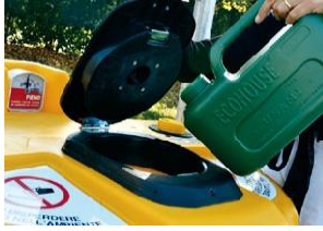
Dotado de cubierta antivuelco