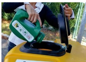
Llévelo a la estación autorizada