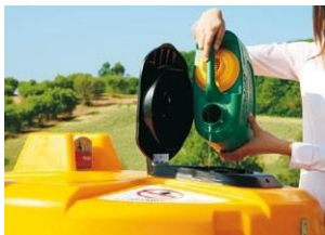
Tapa de transferencia grande