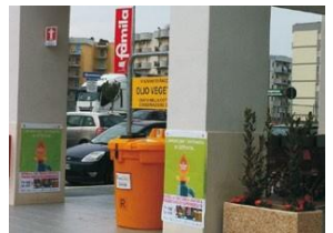
Instalación en supermercado