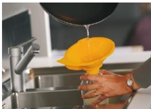
Equipado con un cómodo agarre lateral y una gran boca

Se completa con una tapa de cierre que evita la salida de olores desagradables y es extraíble para facilitar las operaciones de limpieza. La tapa también se puede personalizar completamente con tapones y etiquetas. La geometría de la boca la hace extremadamente versátil y permite su uso en diferentes tipos de botellas con diferentes bocas, desde la botella pequeña de medio litro hasta la más grande con boca más ancha. La tapa también está equipada con un asiento especial que sujeta la tapa de la botella utilizada para la recolección para que pueda reutilizarse para cerrar la botella una vez que esté llena. El soporte para gorras también le permite utilizarlo con botellas de diferentes diámetros.