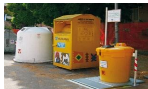
Instalación en un centro de acopio