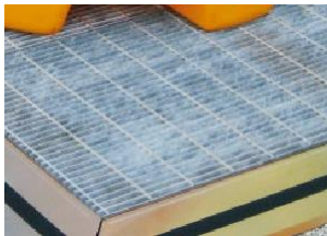
El agua de lluvia no se estanca gracias a las ranuras especiales colocadas en la parte inferior