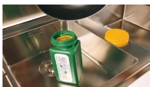
Filtra y recupera con la rejilla de contención