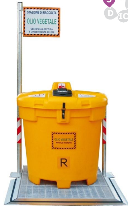
La capacidad de contención de los paños es de aproximadamente litros cada uno. uno para un total de 12 litros por plataforma.

La reposición de los paños se debe realizar en base a derrames (máx. 10/12 lt. aprox.) y se deben desechar de acuerdo con la normativa vigente.