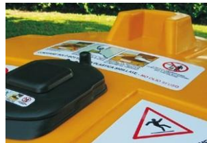
Equipado con pegatinas explicativas.