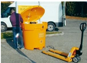
Se libera fácilmente