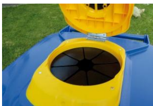
Se suministra con tapa NCP con rejilla para botellas