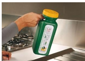
Es fácilmente transportable