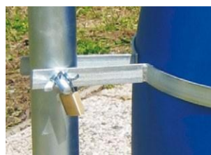
Candado de anclaje