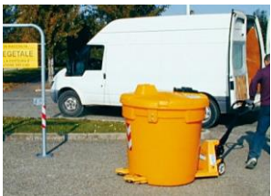
Es fácil mover incluso cuando está vacío