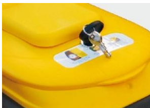
Cerradura opcional con llave universal

Las tapas con rejilla NCP y H-OLI para botellas son aptas para soportar los agentes atmosféricos y han sido diseñadas para facilitar la entrega de residuos y aumentar la seguridad del usuario que la utiliza. Ambas tapas están provistas de una rejilla para botellas que no permite retirar las botellas ya introducidas en el contenedor.