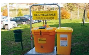
Instalación en la zona verde

OLIVIA ® 200 consiste en dos contenedores insertados uno dentro del otro.