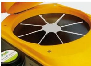
Rejilla de goma para botellas