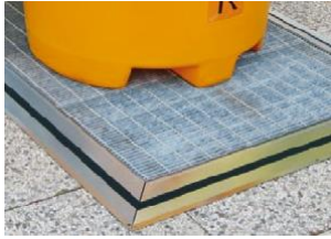
Dotada de rampa con adhesivo antideslizante

Dispone también de una tela especial hidrófuga con alto poder de absorción de aceite para dejar escapar el agua de lluvia, a través de unas ranuras especiales colocadas en el fondo del depósito, y así evitar el estancamiento del agua y consecuencias desagradables como la proliferación de mosquito tigre