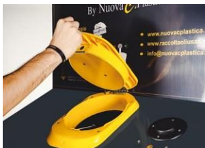
Introducir la botela perfectamente sellada