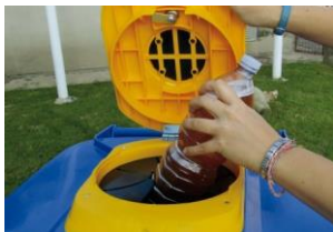
Introducir la botella perfectamente sellada

OLIVBOX 200 es un contenedor para la recogida selectiva de aceites de cocina usados contenidos en botellas de plástico selladas - sin aceite a granel.