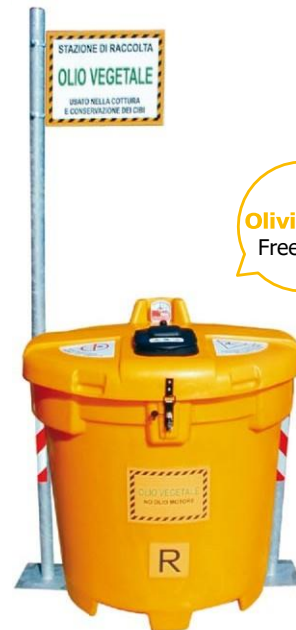
Olivia 500 Free New