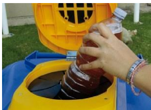
Embudo con rejilla para botellas