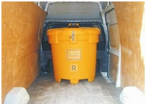
Ideal para recolección completa