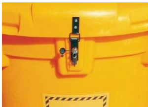
Equipado con bloqueo de llave codificada