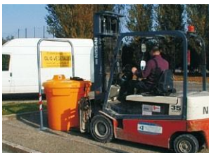
Fácilmente transportable incluso cuando está lleno