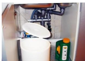
Practico y ahorra espacio