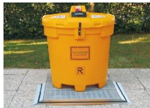
Versión sin postes ni barras anti-vuelco