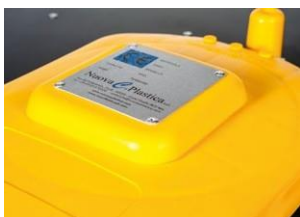
Producto certificado CE

Nuestra línea de contenedores "C" está diseñada para la recolección separada de residuos privados, de condominios y de la calle. El conjunto está compuesto por un contenedor externo en chapa pintada con un producto ad-hoc que permite que el contenedor no se caliente durante la exposición al sol, y un contenedor interno de plástico (EN840; Directiva Europea 2000/14/EG) equipado con ruedas para facilitar el vaciado y que actúa como depósito de contención; Se pueden recoger cantidades de residuos desde 120lt hasta 360lt, dependiendo del modelo del contenedor. El contenedor exterior de chapa está equipado con una puerta que permite introducir el carro en su interior una vez lleno (la puerta está equipada con una cerradura para garantizar el acceso sólo al personal autorizado).