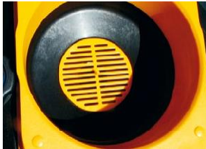
Embudo para aceite a granel con filtro integrado