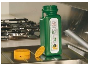
Filtra tu aceite usado con accesorios suministrados