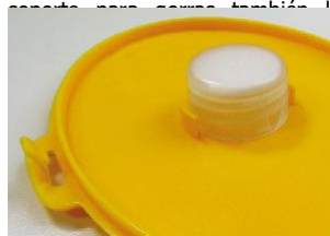
Completo soporte para gorras