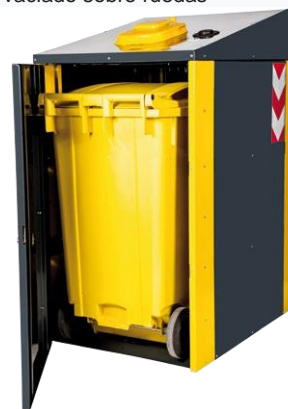
Panel equipado con cerradura para vaciado sobre ruedas

Los contenedores están equipados con adhesivos reflectantes resistentes al sol y los agentes atmosféricos.