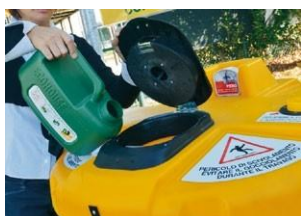
Llévelo a las estaciones de recolección correspondientes